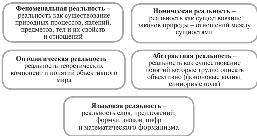
Рисунок 2 – Реальность как существование (составлено авторами)

Понятие «физическая реальность» является фундаментальным в физике XX века и характеризует точку зрения объективного мира, который изучает физика. Альберт Эйнштейн использовал это понятие для описания природы физического знания. Ученый писал, что в доквантовой физике не было сомнения, как необходимо трактовать этот термин [2]. Реальность физика как ученого – это реальность, которая интерпретируется с помощью определенной теории физики. Любая реальность носит теоретико-модельный характер, состоит из системы теоретических компонентов объективного мира природы. Проанализировав смысловую тонкость вышеописанной проблемы реальности как существования, мы считаем необходимым продемонстрировать основные концепты на рисунке 2.