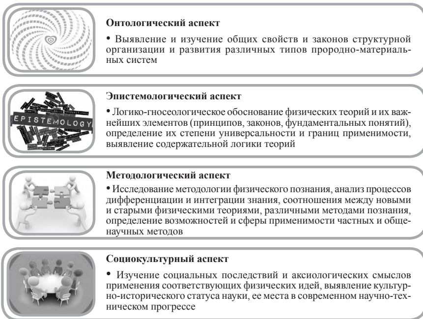
Рисунок 1 – Аспекты философии физики (составлено авторами)

несколько оснований физики: онтологический, логико-гносеологический, методологический и социокультурный вектор развития физики как науки.